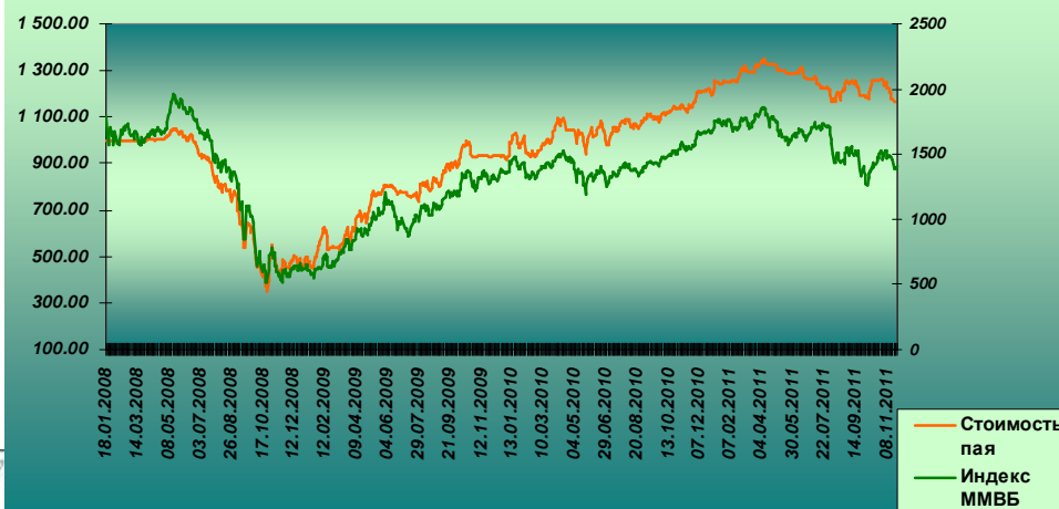
Изменение стоимости пая ОПИФСИ "ТФБ Решительный" и индекса ММВБ