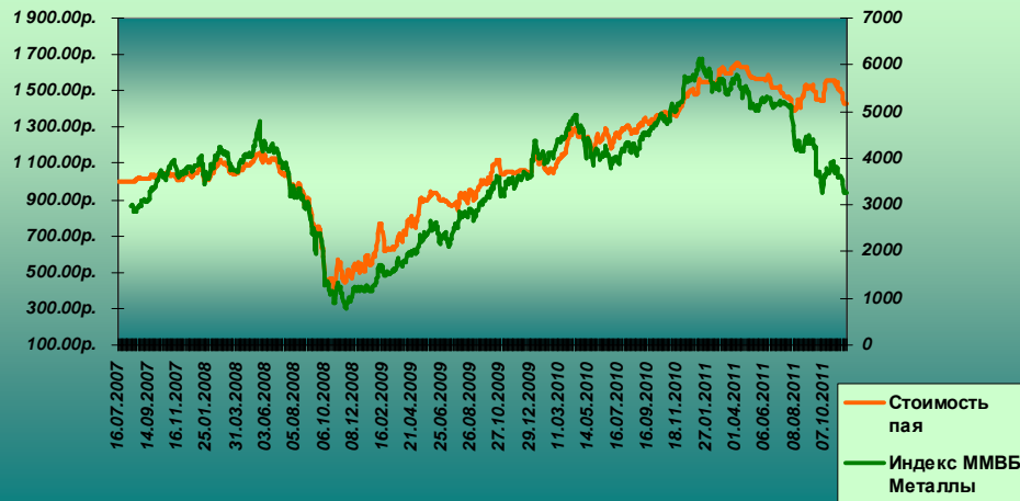
Изменение стоимости пая ОФБУ "Фонд золотой" и индекса "ММВБ-Металлургия"