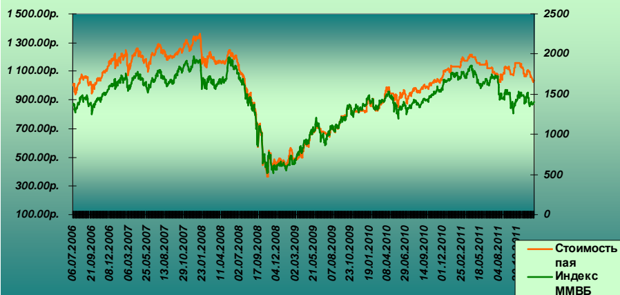
Изменение стоимости пая ОФБУ "Фонд российских акций" и индекса ММВБ